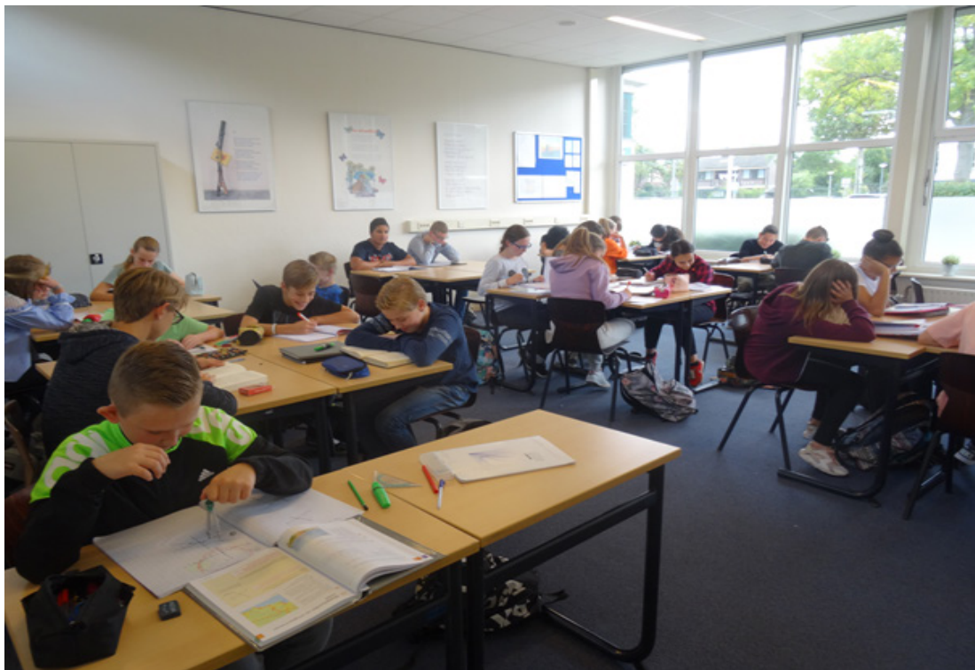
Artikel Rozenburgse Courant van 18 oktober 2017.

De leerlingen en het team zijn tot nu toe tevreden over het systeem. “Er wordt echt gewerkt.” Het team gaat vanaf januari ook een beloningssysteem gebruiken. “Leerlingen die het goed doen, kunnen tijdens een van de huiswerkmomenten workshops gaan volgen als muziek, fotografie, koken, techniek en sport. We hopen daar ongeveer een derde van 185 leerlingen enthousiast voor te krijgen.”