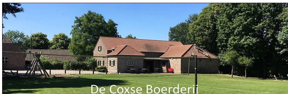
De Coxse Boerderij

Helaas brak toen de laatste dag alweer aan. Een stevig ontbijt, spullen inpakken, zalen schoonmaken, laatste afwas wegwerken en toen reed de bus al voor. Na een lekkere plons in het zwembad waren we rond de klok van 14.45 alweer in Rozenburg en kwam een abrupt einde aan; elke ochtend stevig ontbijten, ochtendgymnastiek, een week zonder telefoon, een week niet gamen, corveediensten, je eigen afwas doen, bordspelletjes spelen, mensen op straat aanspreken, allerlei leuke activiteiten en de gezelligheid op de slaapzalen die soms midden in de nacht door de leiding afgekap werd.